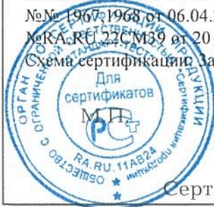
Схема сертификации За.

ДОПОЛНИТЕЛЬНАЯ ИНФОРМАЦИЯ Протоколов испытаний № 1906 от 16.08.2013, №№ 1951, 1952 от 06.03.2015 НИИСФ ИСПЫТАТЕЛЬНАЯ ЛАБОРАТОРИЯ ТЕПЛОФИЗИЧЕСКИХ И АКУСТИЧЕСКИХ ИЗМЕРЕНИЙ, №№ 1967, 1968 от 06.04.2016 ИСПЫТАТЕЛЬНАЯ ЛАБОРАТОРИЯ «Стройполимертест» аттестат аккредитации № RA.RU.22CM39 от 20 октября 2015г. Инспекционный контроль: июль 2018г.